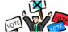
CUALQUIER OTRO EVENTO POLÍTICO