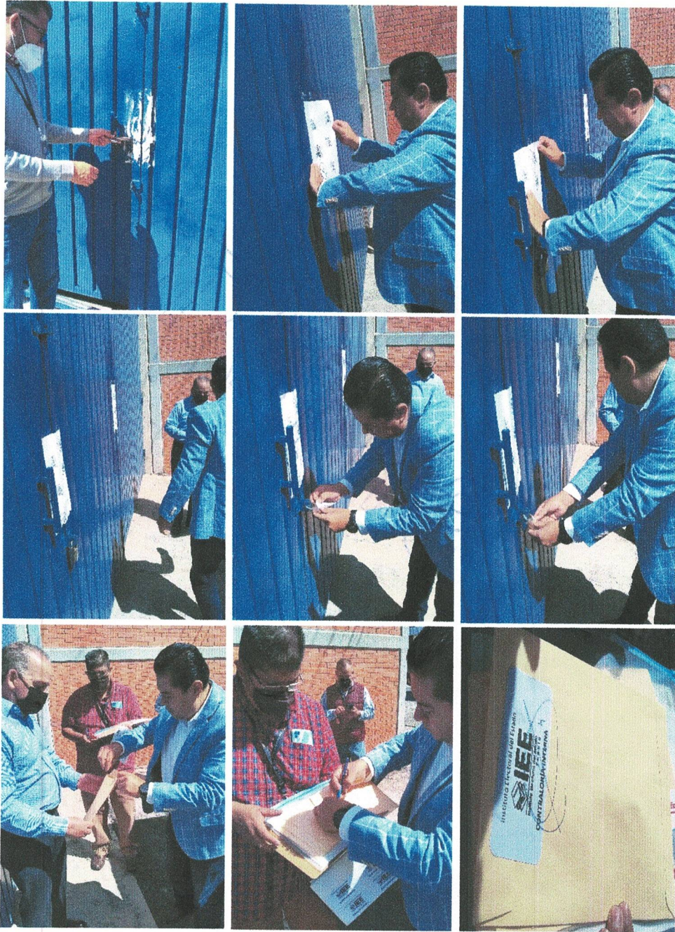
Cierre y sellado del sobre, candado, puerta y el zaguán de la bodega electoral de este Instituto Electoral del Estado.