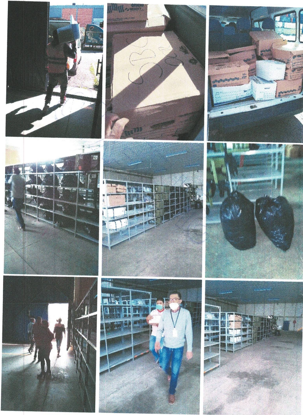
Actividad del personal de Organización Electoral al interior de la bodega electoral, respecto a extraer la documentación que se encontró al interior de las cajas paquete electoral, del Proceso Electoral Estatal Extraordinario 2022.