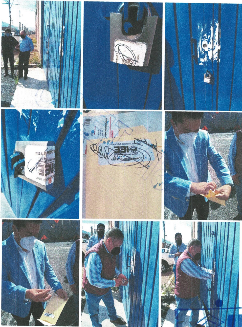
Apertura del sobre, candado y puerta de la bodega electoral de este Instituto Electoral del Estado.