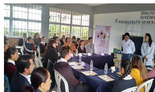
Diálogo Juvenil 10, en el Bachillerato Frida Kahlo, Zacatlán.