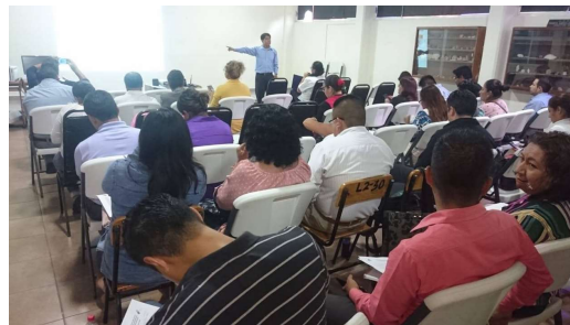
Capacitación Autoridades Escolares. Sede: Tehuacán, Puebla