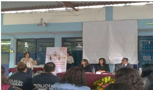
Diálogo Juvenil 01, en el Bachillerato Carlos Camacho Espíritu.