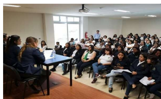
Debate Escolar, Licenciatura en Educación Inicial del Benemérito Instituto Normal del Estado; veinte de mayo de dos mil diecinueve.

Finalmente el día veintidós de mayo de dos mil diecinueve, la Dirección de Capacitación Electoral y Educación Cívica dio seguimiento a la Jornada Electoral,