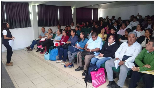
Capacitación Autoridades Escolares. Sede: CENHCH, Puebla