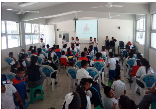
Taller de "Igualdad y no discriminación", sede Zacatlán, Puebla

Cabe mencionar que la citada acción tuvo como objetivo central, reflexionar con este sector de la población estudiantil sobre los conceptos de igualdad y no discriminación para la construcción de una convivencia inclusiva y armónica en sus entornos más cercanos.