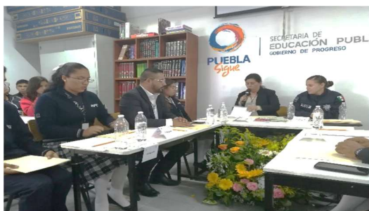
Diálogo Juvenil 03, en el Bachillerato Raquel Flores González.