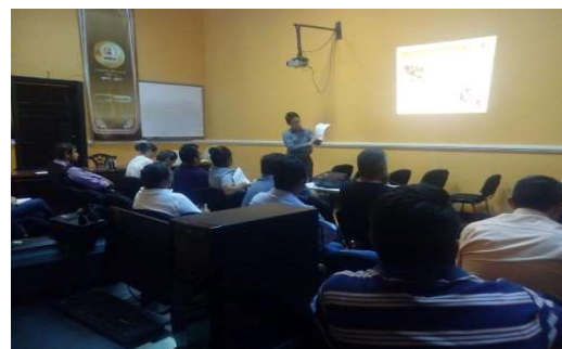
Capacitación al personal docente del S.E.T.E.P designado como funcionariado de mesas receptoras del voto; cuatro de abril de dos mil diecinueve.