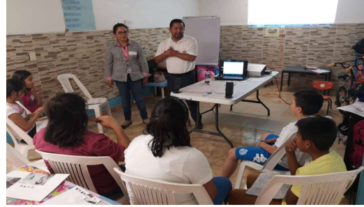
Taller: "Conociendo los Valores", Ejército de Salvación, Hogar de Niños en Puebla A.C.