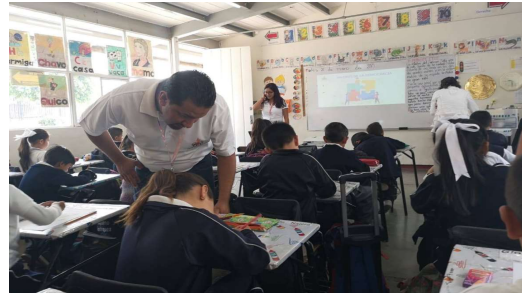
Taller: "Conociendo los Valores", Escuela Primaria Profesora Paulina Maraver Cortés.