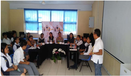
Diálogo Juvenil 05, en el Bachillerato Netzahualcóyotl, Cuetzalan del Progreso.