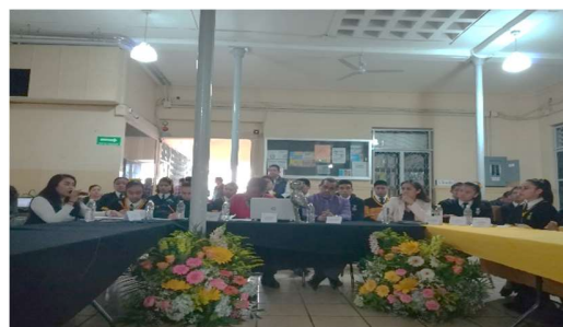
Diálogo Juvenil 02, en el Bachillerato Hermanos Serdán.