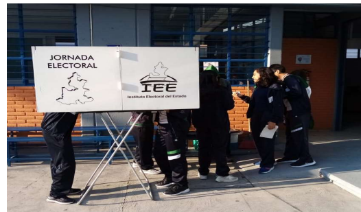
Jornada Electoral, en el Bachillerato Sor Juana Inés de la Cruz