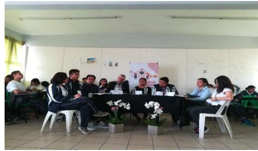
Diálogo Juvenil 06, en el Bachillerato Digital 31.