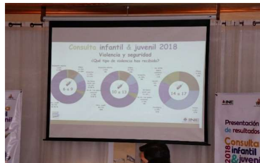
Presentación de los resultados de la Consulta Infantil y Juvenil 2018, llevada a cabo en el Hotel Lastra en Puebla