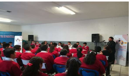
Diálogo Juvenil 09, en el Bachillerato Héroes de la Reforma.