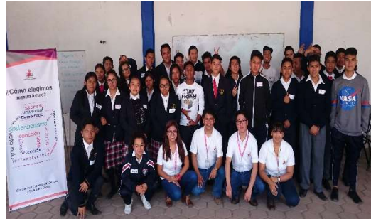
“Voto libre y razonado”: ¿Cómo elegimos nuestro futuro?, Universidad Metropolitana de Puebla y Bachillerato “Gilberto Bosques Saldivar”