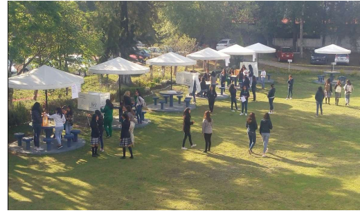
Jornada Electoral, Licenciatura en Educación Inicial del Benemérito Instituto Normal del Estado; veintidós de mayo de dos mil diecinueve.