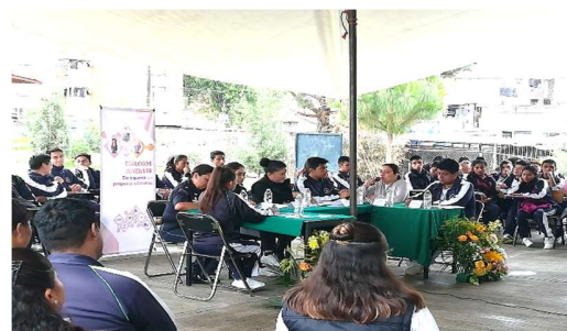
Diálogo Juvenil 04, en el Bachillerato David Alfaro Siqueiros.