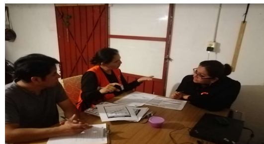
Notificación y capacitación a la ciudadanía insaculada para el proceso electoral plebiscitario 2019