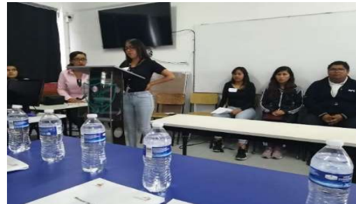
Debate Electoral, realizado en el Bachillerato Raquel Flores González.