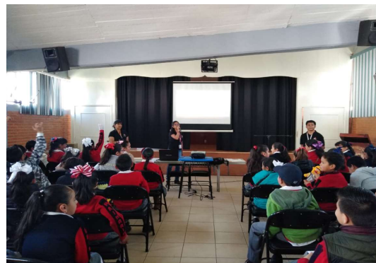
Taller de "Igualdad y no discriminación", sede Acatlán, Puebla