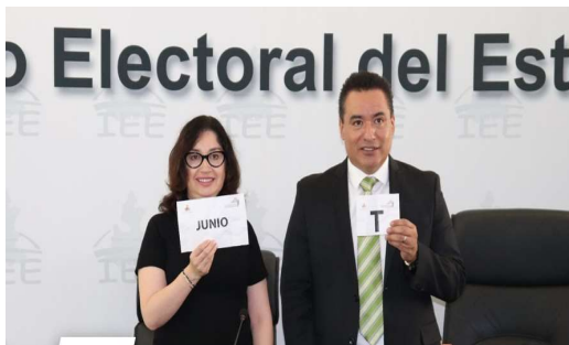
Sorteo del mes calendario y letra del abecedario

Así mismo, durante esta sesión se llevó a cabo el sorteo de las letras que conforman el alfabeto, a fin de obtener la letra a partir de la cual, con base en la inicial del primer apellido, se seleccionaron a las y los ciudadanos que integraron las mesas receptoras durante la jornada plebiscitaria del primero de diciembre del dos mil diecinueve, dando como resultado de dicho sorteo la selección de la letra “T”.