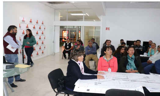
Capacitación a capacitadoras y capacitadores plebiscitarios 2019