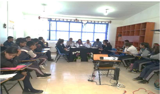
Diálogo Juvenil 07, en el Bachillerato la Libertad, Zacapoaxtla.