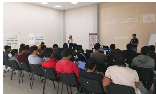
“Voto libre y razonado”: ¿Cómo elegimos nuestro futuro?, Universidad Metropolitana de Puebla, veintisiete y veintinueve de mayo de dos mil diecinueve.

Con relación al Bachillerato General Oficial “Gilberto Bosques Saldívar”, dicho taller se llevó a cabo los días tres de mayo y veinte de junio de dos mil diecinueve en las instalaciones de la citada institución, ubicada en Calle Jacaranda s/n, Colonia Solidaridad, Puebla, donde se reportó para el primer ejercicio la asistencia de