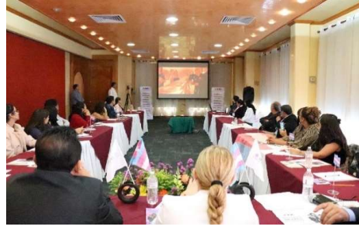
Presentación del Protocolo Trans, llevada a cabo en el Hotel Lastra en Puebla