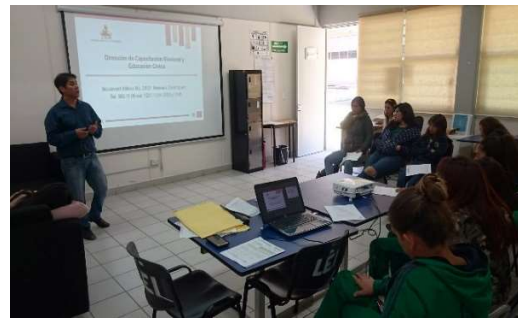
Capacitación a alumnas de Licenciatura de Educación Inicial del BINE; once de abril de dos mil diecinueve.

Asimismo, la Dirección de Capacitación Electoral y Educación Cívica asesoró y dio seguimiento al desarrollo del “Debate Escolar” organizado por las autoridades de la institución en coadyuvancia con el Consejo Electoral Escolar, que se llevó a cabo en la sede que alberga a la Licenciatura en Educación Inicial el día veinte de mayo de dos mil diecinueve, donde las candidatas que representaron a las planillas contendientes expusieron sus propuestas ante la comunidad estudiantil que presenció, escuchó y cuestionó los planteamientos realizados por cada una de las participantes, que respondieron a todas las dudas manifestadas por sus compañeras.