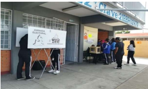
Jornada Electoral, en el Bachillerato Raquel Flores González.