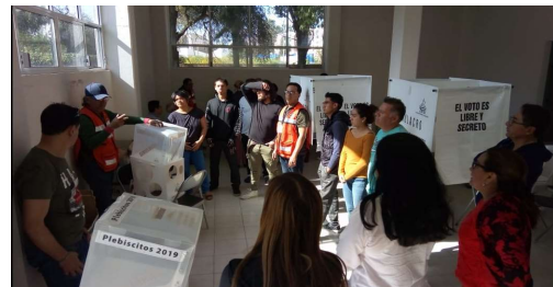
Capacitación y simulacros llevados a cabo con funcionarias y funcionarios de mesas receptoras para el proceso plebiscitario 2019