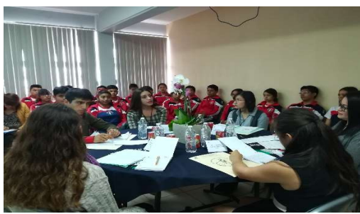
Diálogo Juvenil 08, en el Bachillerato Cadete Juan Escutia.